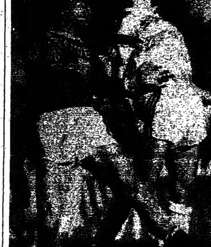
من مباراة راسينج بوليس وتولوز (١-١)

تميزت مباريات الاسبوع اللغز والمضطربين لبطولة فرنسا لكرة القدم بلهزم الخصاص الطامحة بورود صفر ٢/١ وكان ربحاً لذلك فان الفريق يتبعه ملاحظه الماشر مرسلينا الذي يقفه ميونخا تفحص الى ان تغلب فقط. وفي ما يلي التلخيص للمباريات الاسبوع: